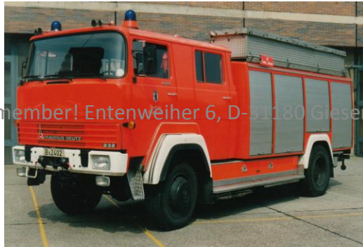
Remember! Entenweiher 6, D-31180 Giesen

Der Bausatz 045.11.19 beinhaltet die modifizierten Teile für die späte, modellgepflegte Variante (B-2402).