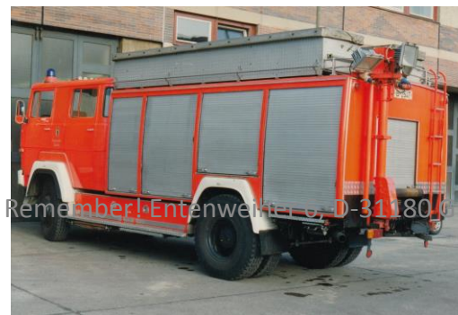
Remember! Entenweiher 6, D-31180 Giesen