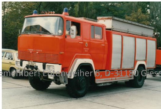
Remember! Entenweiher 6, D-31180 Giesen