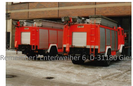
Remember! Entenweiher 6, D-31180 Giesen