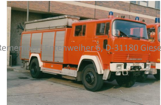
Remember! Entenweiher 6, D-31180 Giesen