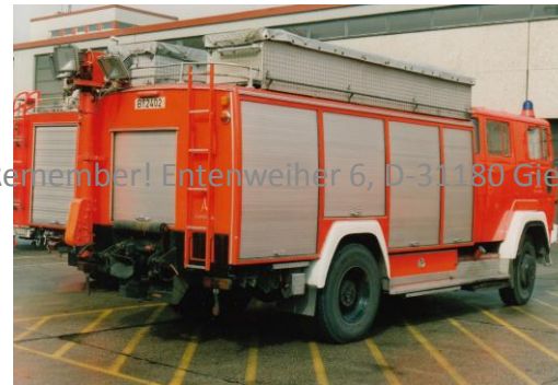
Remember! Entenweiher 6, D-31180 Giesen