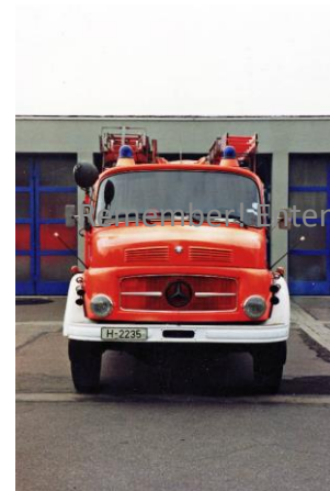
Remember! Entenweiher 6, D-31180 Giesen