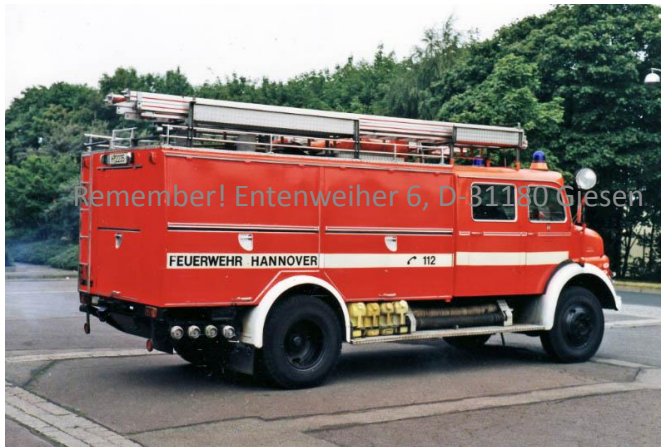
Remember! Entenweiher 6, D-31180 Giesen