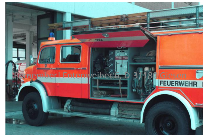
Remember! Entenweiher 6, D-31180 Giesen