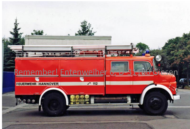
Remember! Entenweiher 6, D-31180 Giesen