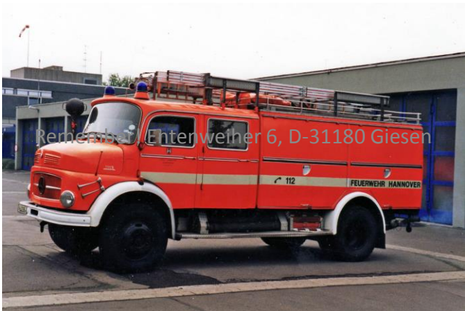
Remember! Entenweiher 6, D-31180 Giesen