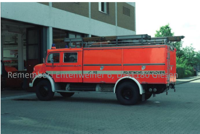
Remember! Entenweiher 6, D-31180 Giesen